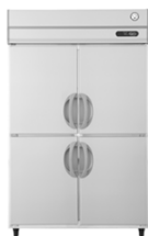
タテ型冷蔵庫・冷蔵庫