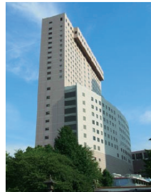
国際ファッションセンタービル 〒130-0015 東京都墨田区横綱一丁目6番1号 TEL.03-5610-5801 最寄駅:都営地下鉄大江戸線「両国駅」A1出口に直結 JR中央・総武線「両国駅」東口より徒歩約6分、西口より徒歩約7分