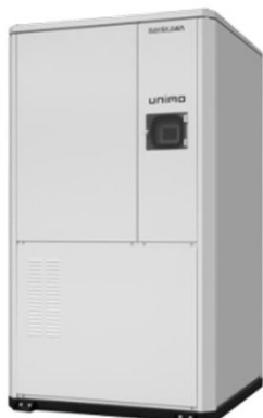
水熱源エコキュート UNIMO WW