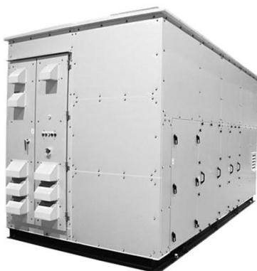
CO 2 ヒートポンプ式 デシカント除湿機 CHRIS