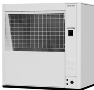
空気熱源エコキュート UNIMO AW