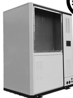
CO 2 熱風ヒートポンプ EcoSirocco