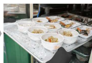
予約した時刻に自動再加熱