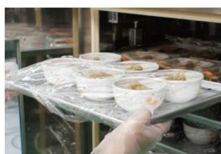
設定時刻までチルド保存