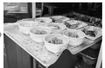
予約した時刻に自動再加熱