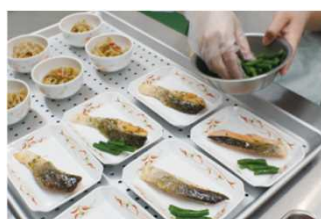
チルド状態で盛り付け