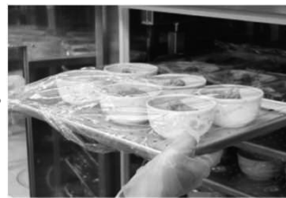
設定時刻までチルド保存