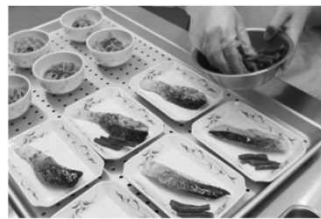
チルド状態で盛り付け