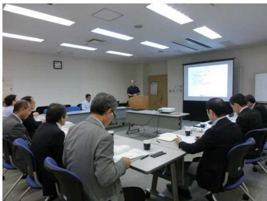
写真1 坪井教授から説明を受ける部会委員

多種多様な分野で活躍・進展する“光技術”に益々関心を高めることになった見学会であった。