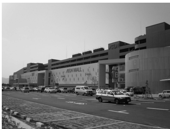
図1 イオンモール草津外観

外観デザインは、琵琶湖湖畔・田園風景を配慮しており、また、環境配慮型照明デザインなどデザインと省エネの融合を図る計画となっている（図1）。